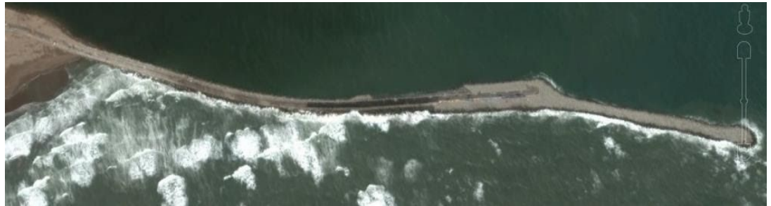
Imagen N°4: Escollera Sur

SECTOR 4: Escollera Sur. Margen Necochea. Ubicado según el punto de coordenadas 38^{\circ}35'16.93''S , 58^{\circ}41'22.10''O y 38^{\circ}34'52.23''S , 58^{\circ}42'05.77''O .