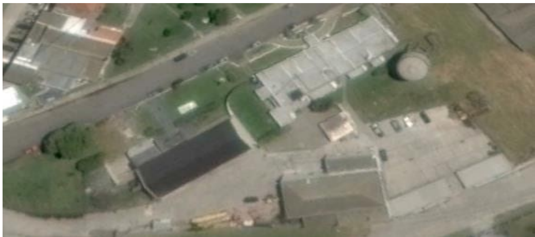
Imagen N°5: Oficinas administrativas y alrededores CGPQ

SECTOR 5: Ubicado según el punto de coordenadas 38^{\circ}34'30.74''S , 58^{\circ}42'13.53''O . Está conformado por el Sector administrativo que ocupa el CGPQ.