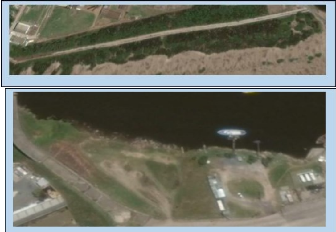
Imagen N°6: Espacios verdes jurisdicción CGPQ