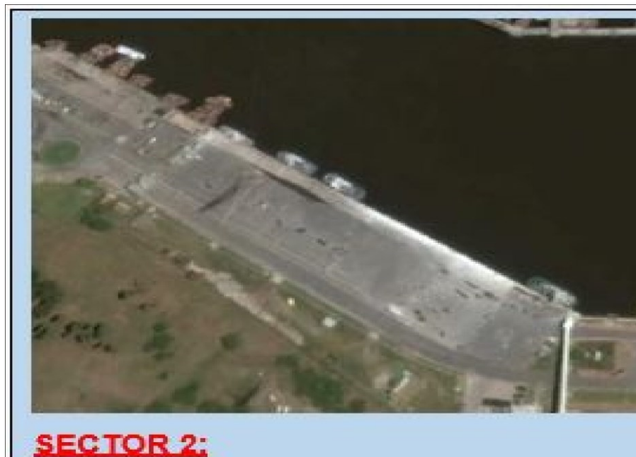
Imagen N°2: Muelle margen Necochea: Sitios 7-8-9-10